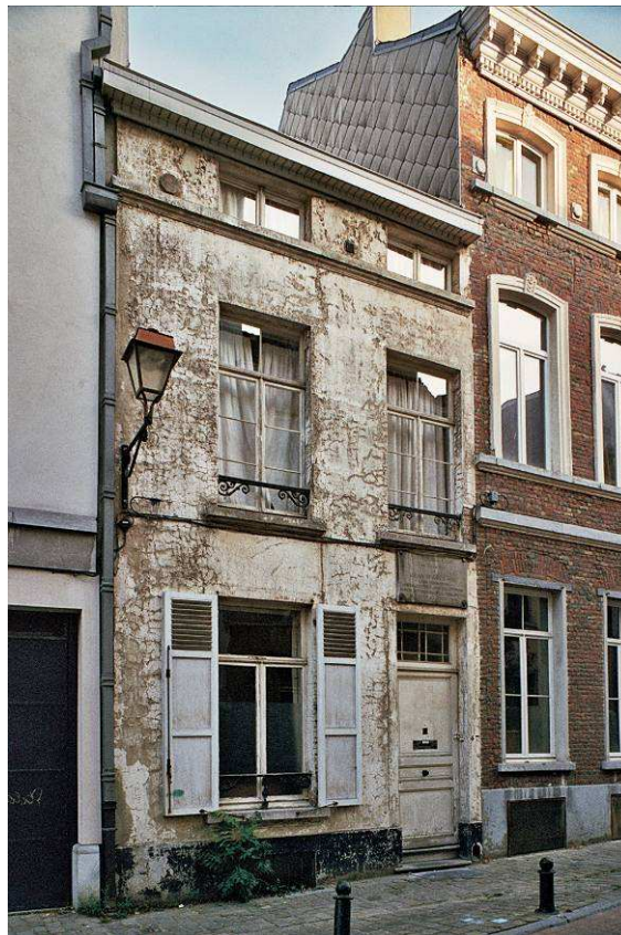
Jean d'Ardenestraat 47, woning uit het midden van de 19 e eeuw (foto 2009).

De oudst bewaarde woningen stammen uit de jaren 1820 en zijn hoofdzakelijk rijwoningen. Traditioneel hebben ze grosso modo één of meerdere gewelfde kelders en een onderbouw in lokale zandsteen. Hun bepleisterde gevels met twee tot drie traveeën en evenveel bouwlagen verlenen hun een neoclassicistisch aspect. De woningen kenmerken zich verder door de luiken voor de vensters van de benedenverdieping, vensterleuningen op de verdiepingen en deuren met bovenlichten met ijzeren roeden.