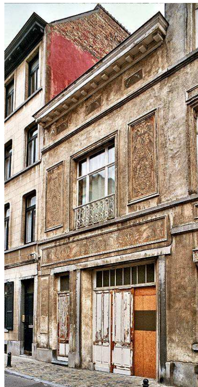
←← Vleurgatsesteenweg 77, burgerwoning in neo-Vlaamse renaissancestijl, 1890 (foto 2009).