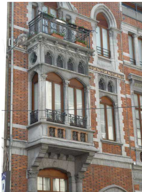
Kapitein Crespelstraat 25, detail van de neogotische gevel, 1881 (foto 2009).

Naast de verscheidenheid aan eclectische gebouwen met renaissance-elementen komt vanuit de herontdekking van de nationale bouwstijlen ook de gotiek op het voorplan. De oudste voorbeelden ervan in Opper-Elsene liggen beiden in de Kapitein Crespelstraat. In 1881 ontwerpt architect Emile HELLEMANS er zijn eigen woning 23 . Hoewel de compositie nog heel traditioneel is komt het neogotisch karakter ervan tot uiting in de spitsbogen, drielobbige venstertjes en dito kroonlijst. Verder in de straat treffen we een fraai voormalig herenhuis 24 in neo-Brugse gotiek naar een ontwerp van architect Antoine TRAPPENIERS uit 1884. Architect Jean RAMAEKERS past dezelfde stijl toe voor zijn eigenwoning in de Gewijdeboomstraat nr. 98 (1899). De vroeg-gotische ornamentiek vinden we ook terug in het geheel in de P. Spaakstraat (24 en 26) door architect H. SPREUTELS uit 1893. Dautzenbergstraat nr. 42, een ontwerp van architect DELVAUX uit 1903, sluit de neogotische stijl in dit deel van Elsene waardig af.