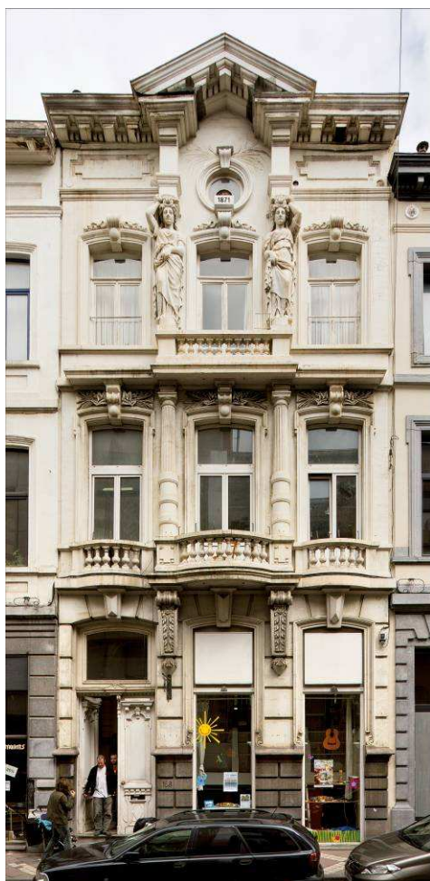
← Elsensesteenweg 188, eclectische burgerwoning, 1877.

In de loop van het midden van de 19 e eeuw evolueert het uniforme neoclassicistische straatbeeld naar een aaneenschakeling van meer gepersonaliseerde huizen. Het neoclassicistisch basisschema bestaande uit een symmetrische gevel met veelal drie bouwlagen en drie traveeën blijft overeind, maar de gevels worden (nogal zwaar) versierd. De benedenverdieping heeft vaak doorlopende schijnvoegen of bossage, niet zelden uitgevoerd in hardsteen. Op de verdiepingen wordt het accent op de centrale travee gelegd die vaak licht vooruitspringt en van balkons is voorzien. Verdiepingen kennen rijkelijke vensteromlijstingen, uitgewerkte borstweringen, zware kroonlijsten en frontonbekroningen. Schoolvoorbeelden van dergelijk classiserend eclectisme zijn het huis onder fronton in de Gewijdeboomstraat nr. 87 (1844) en de nr. 185 (1877) en 188 (1871) langs de Elsensesteenweg.