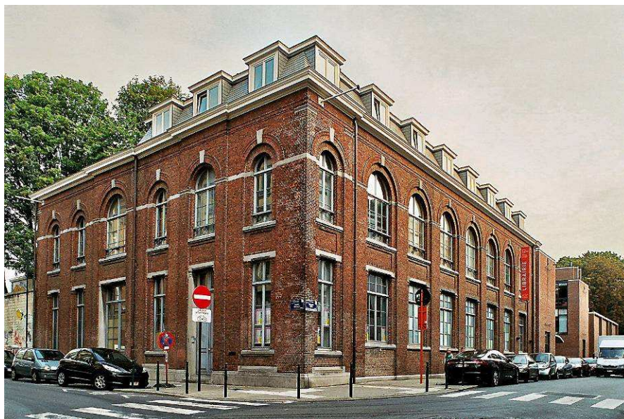
Kluisstraat 55 – Verlaatstraat 2, gevel van het voormalige elektrische onderstation, 1895 (foto 2009).

Grootschalige sites zijn beperkt tot de voormalige pianofabriek in de Keienveldstraat 37 . François BERDEN laat hier zijn neoclassicistisch herenhuis met achterliggende fabriek bouwen in de jaren 1860-1870. Dankzij de productie van buffetpiano's zou deze fabriek uitgroeien tot een van de belangrijkste van België. In 1903 werden de bedrijfsgebouwen opgeslorpt binnen de Confiserie - Chocolaterie Antoine , een chocoladefabriek gesticht in 1850 en die een eeuw later de boeken zal sluiten. Ondanks de functiewijzigingen blijft de fabriek thans nog een fraai voorbeeld van industriële architectuur.