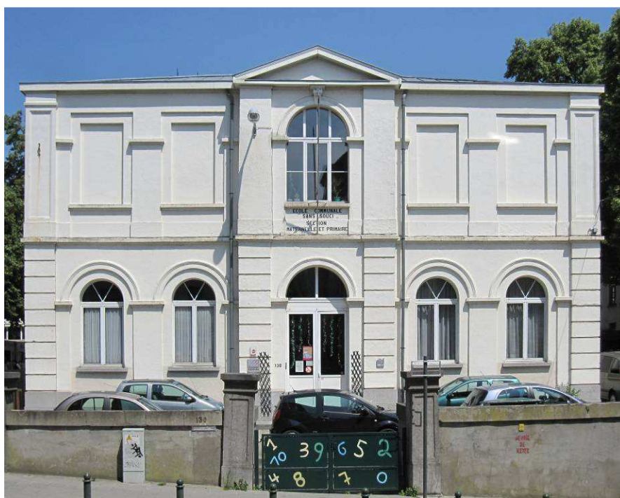
Sans Soucistraat 94, Gemeenteschool nr. 2, 1873 (foto 2011).

De Gemeenteschool nr. 1, gelegen in de Sans Soucistraat 94, is de oudste school van Elsene. Dit neoclassicistisch gebouw wordt in 1858-1860 ontworpen door architect ROUSELLE. Het betreft een langgerekt school met voorgaande koer. Het concept is heel eenvoudig. Het rechthoekig gebouw wordt in het midden door een dubbele gang van elkaar gescheiden en heeft telkens vier leslokalen aan weerszijden van dubbele gang, één voor jongens een ander voor meisjes. In de jaren 1870 wordt het gebouw verhoogd met een bouwlaag.