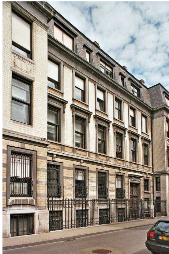
Prins Albertstraat 31, kantoren van nv Solvay, 1883 (foto 2009).