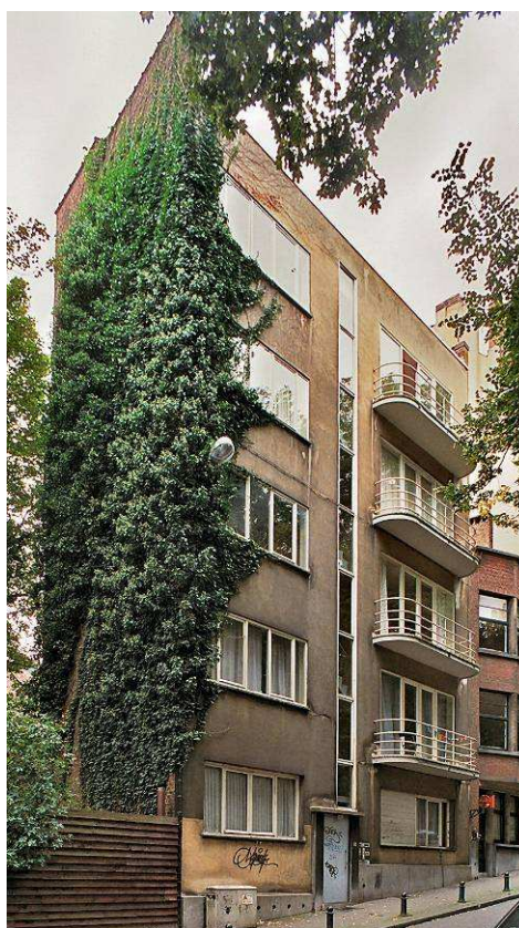
Kluisstraat 28, modernistisch appartementsgebouw door Louis-Herman DE KONINCK, 1935 (foto 2009).

Lucien DE VESTEL bouwde in de Kluisstraat twee verschillende appartementsgebouwen. Naast een verschil in baksteenparement onderscheiden ze zich in de volume- en registerbehandeling. Het laatste appartementsgebouw is naar de hand van Marcel PEETERS en leunt sterk aan bij de Internationale Stijl 31 .