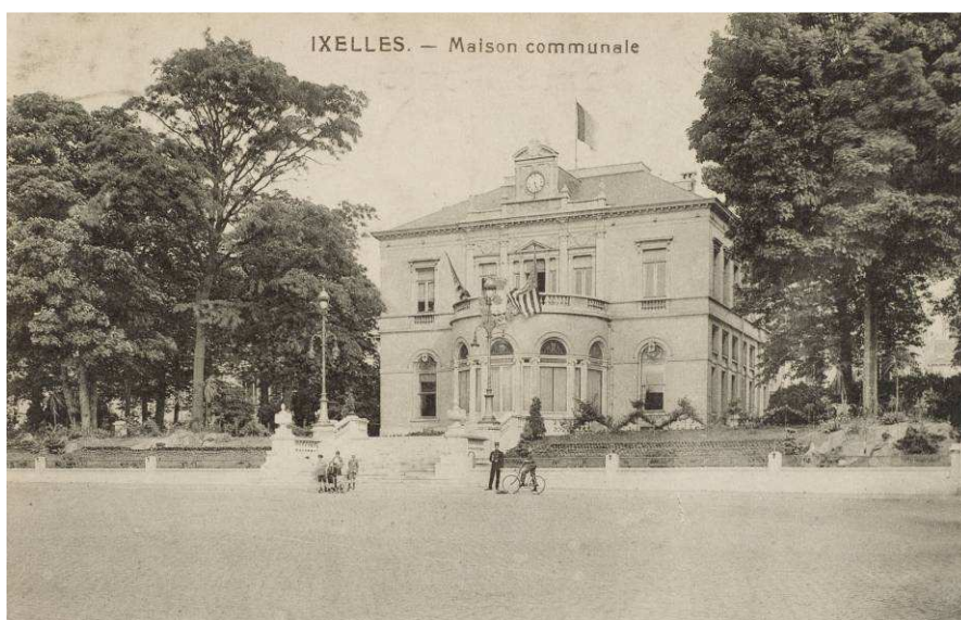
Gemeentehuis van Elsene, net na verfraaiingswerken van 1909.