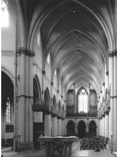
Interieur van de Sint-Gertrudiskerk (1885), heden afgebroken