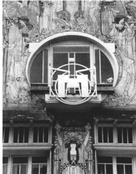
Huis Cauchie (1905). Detail.