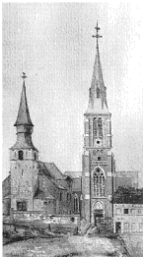
Aquarel van Edmond Serneels uit 1896 met de oude en de nieuwe Sint-Gertrudiskerk in 1886.