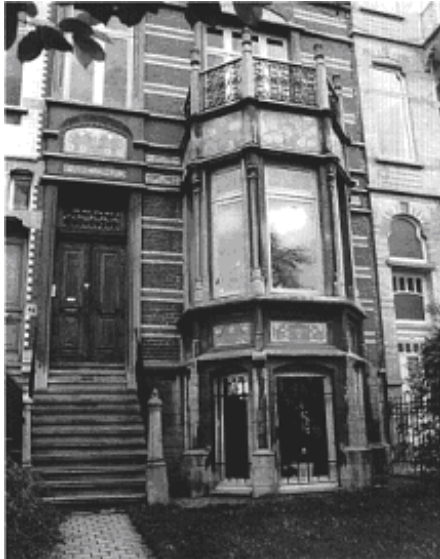
Tervurenlaan 93. Arch. E. Ramaeckers (1898).