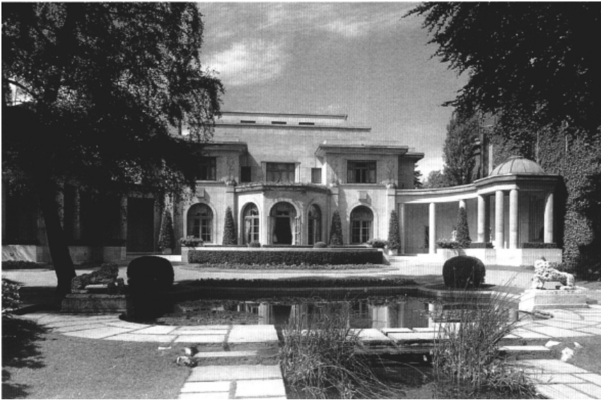
Tervurenlaan. Hotel Bosman, heden afgebroken. Arch. P.H. Collin, 1929.

techniques nouvelles". 36 In de art-deco architectuur gaat het gebruik van traditioneel materiaal – baksteen en steen – en de trouw aan classicistische vormen immers vaak samen met de toepassing van nieuwe technieken. Een huis naar een ontwerp van J. Ghobert (1923) 37 en de woning met (verbouwde) ateliers van architect A. de Saulnier (1931) 38 vormen twee typische stijlvarianten van de art deco: de eerste constructie heeft een strenge, geometrische decoratie – met onder meer cannelures en visgraatmotieven –, het tweede pand ontleent zijn ornamentatie aan de vegetale wereld van bloemen en fruit. Het – afgebroken – hotel Bosman 39 combineerde een strenge compositie, opgebouwd door eenvoudige geometrische volumes, met een somptueus bewerkte decoratie. Deze door P.M. Colin ontworpen luxueuze villa was opgetrokken te midden van een grote tuin.