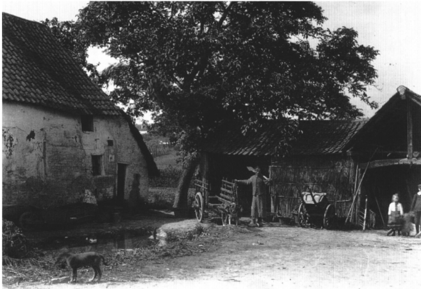
De hoeve Vanderveken op het einde van de 19e eeuw, heden afgebroken, Groothertogstraat (KIK).