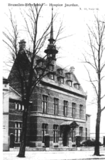
Voormalig godshuis Jourdan. Arch. C. Bosmans en H. Vandeveld. 1887 (Gemeentekrediet).