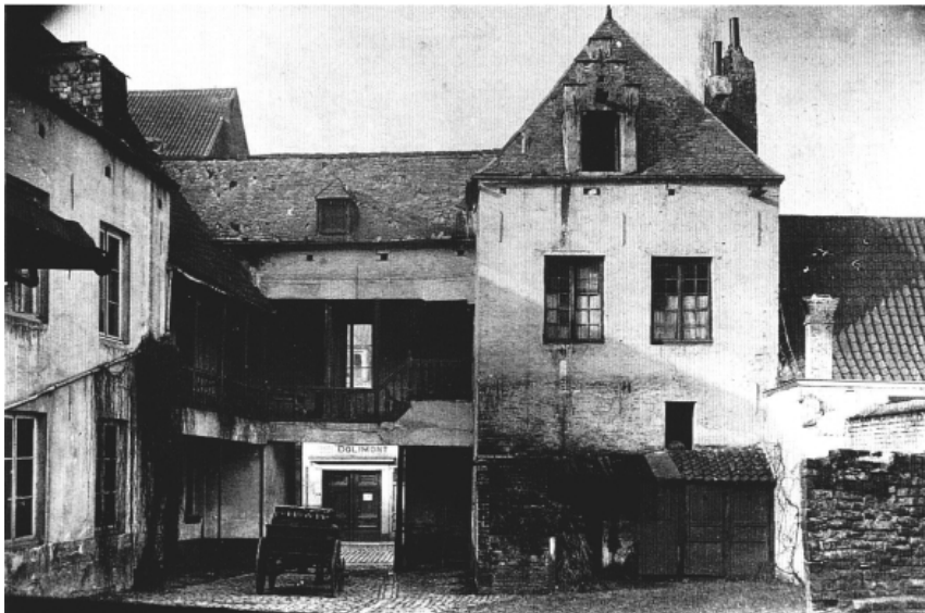
Herberg 'den Morian', Etterbeeksesteenweg (SAB).

Dat was onder meer het geval van 'den Valcke' en 'den Morian' 1 , twee herbergen van het einde van de 16e of het begin van de 17e eeuw. 'Den Morian' verschijnt op een figuratief plan van 1724 als een U-vormige constructie met een puntgevel en getrapte dakkapellen. In het Felix Happark zijn nog de resten van een eveneens 16e eeuws buitenverblijf zichtbaar. 2 Deze fraaie, door een vijver omgeven woning in Vlaamse renaissancestijl bestond uit een hoofdvlugel, die aan weerszijden geflankeerd was door een vierkante toren onder tentdak. Verder bevond 'den Bisdop' zich in Etterbeek, een vrij groot gebouw met twee vleugels, respectievelijk uit de 15e eeuw en uit 1650. De constructie stond er nog steeds in 1875 3 en bezat een zandstenen gevel met kruiskozijsen. De vroegere Sint-Gertrudiskerk, die in 1886